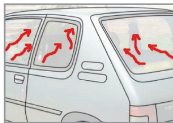
2. Estos objetos calientes calientan el aire atrapado en el coche, semejante a un horno de convección.